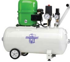
SKA SESSİZ HAVA KOMPRESÖRÜ SILENT AIR COMPRESSOR