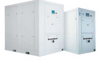
TİD VİDALI HAVA KOMPRESÖRÜ AIR COMPRESSOR WITH SCREW