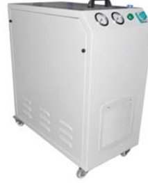
SKK SESSİZ HAVA KOMPRESÖRÜ (KASALI MODEL) SILENT AIR COMPRESSOR (CLOSED MODEL)