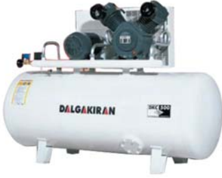
KOMP PİSTONLU HAVA KOMPRESÖRÜ AIR COMPRESSOR WITH PISTON